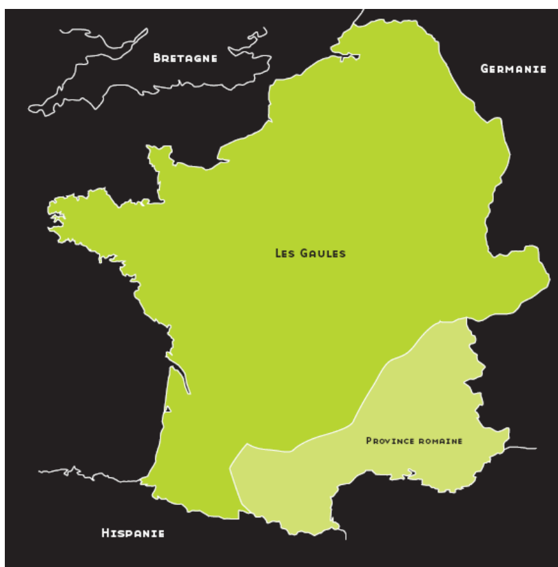
Le territoire de la Gaule d'avant la conquête romaine (vers 60 avant JC).

Sont qualifiés de Gaulois les peuples celtes qui, au terme de leurs migrations, se sont établis dans la France actuelle mais aussi en Belgique, en Suisse ainsi que dans le nord de l'Italie d'aujourd'hui que cette carte ne fait pas apparaître. En -60, le sud de l'Italie était déjà romain.