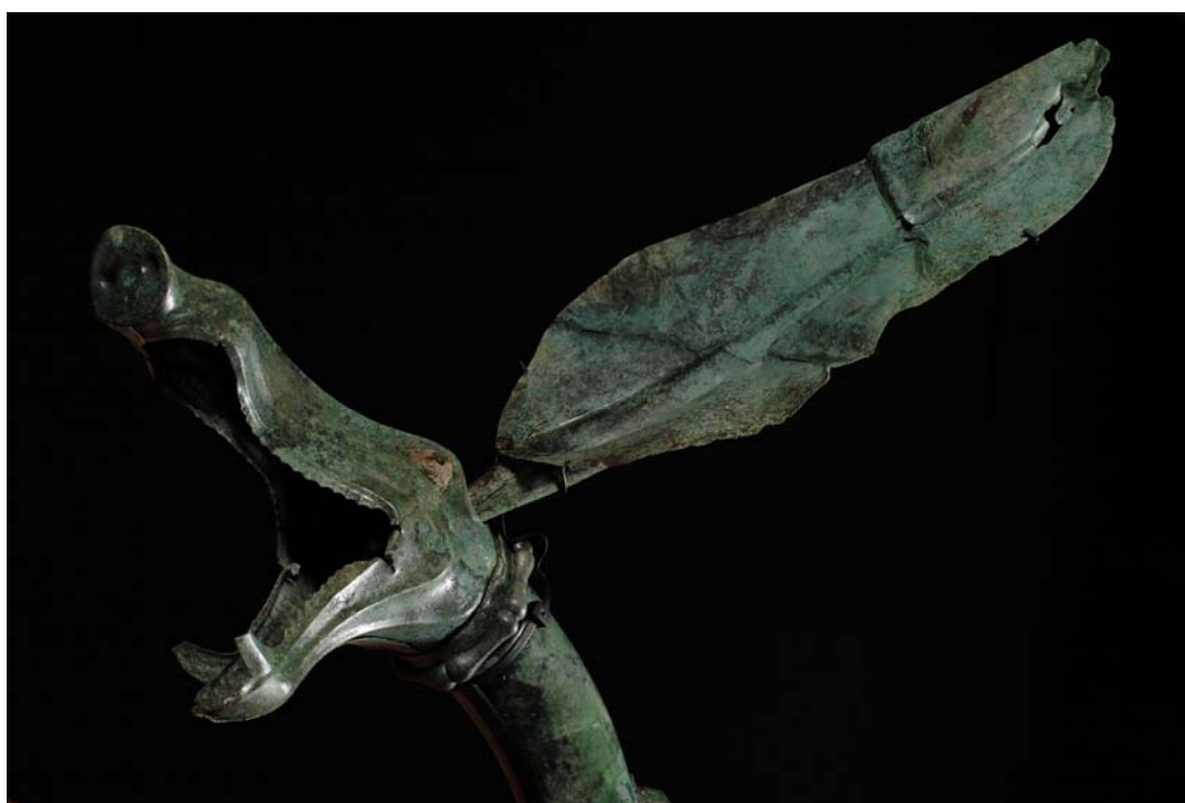
Carnyx en bronze entre le IV e et le II e siècle avant JC, découvert en 2004 sur le site de Tintignac en Limousin.