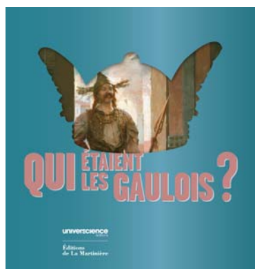
Catalogue de l'exposition Gaulois, une exposition renversante !