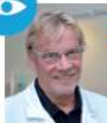
Ophtalmologie Dr Georges CHALLE