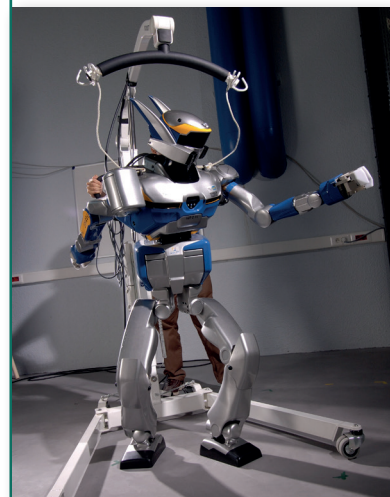
Robot HRP2 - Il existe quinze exemplaires de ce robot dans le monde, dont celui présenté dans l'exposition.

Trilingue (français, anglais, espagnol). À partir de 11 ans.