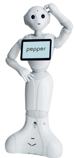
Pepper par Softbank Robotics