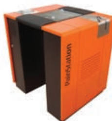
Painstation © / //////////FUR///

Fondateur de la Fura dels Baus, Marcel.lí Antúnez Roca est internationalement reconnu pour ses performances excentriques et ses installations robotiques.