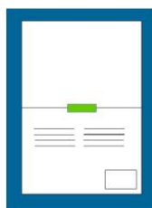
recto : côté texte (date cachée)