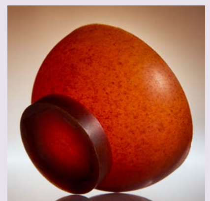
MR.84, 2016, materiales: Agar. Creado por Samuel Tomatis.