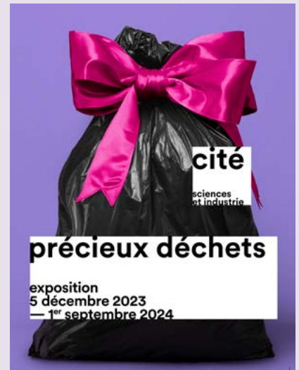
Exposici n triling e (franc s, ingl s, espa ol) A partir de 15 a os.

La Era de los Residuos (t tulo original Waste Age: What Can Design Do? ) es una exposici n creada por el Design Museum de Londres