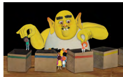
Peut-on ranger les gens dans des boîtes ?