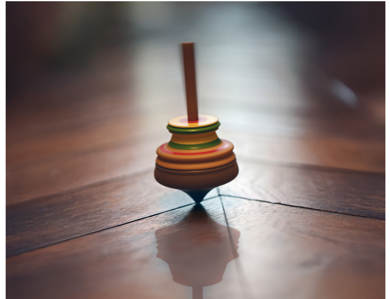
Les promesses du monde Le Gentil Garçon, 2026